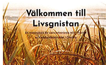
Kommande händelser på Livsgnistan

Livsgnistans broschyr och visitkort med våra kontaktuppgifter, har delats ut till alla kuratorer och kontaktsjuksköterskor, för vidare befordran till patienter och närstående.